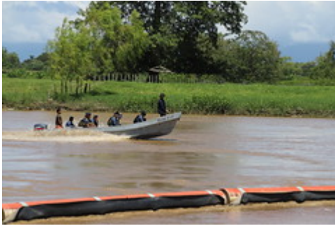
Motagua 3 by Ministerio de Ambiente y Recursos Naturales uploaded on 20 Aug 2021