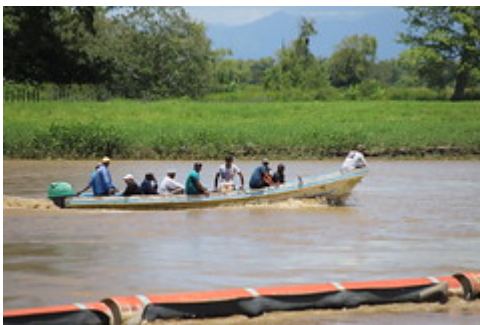
1 Motagua by Ministerio de Ambiente y Recursos Naturales uploaded on 20 Aug 2021