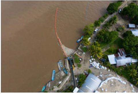
MINISTRO VISITA IZABAL-13