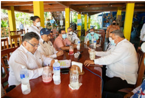
MINISTRO VISITA IZABAL-5 by Ministerio de Ambiente y Recursos Naturales uploaded on 20 Aug 2021