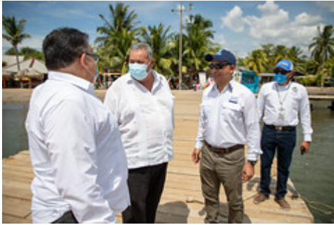
MINISTRO VISITA IZABAL-9 by Ministerio de Ambiente y Recursos Naturales uploaded on 20 Aug 2021