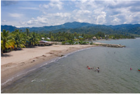
MINISTRO VISITA IZABAL-4 by Ministerio de Ambiente y Recursos Naturales uploaded on 20 Aug 2021