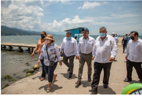
MINISTRO VISITA IZABAL