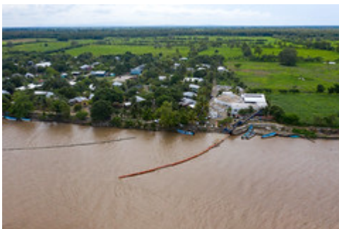
MINISTRO VISITA IZABAL-11