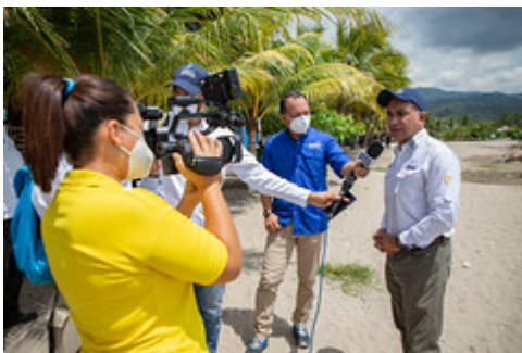
MINISTRO VISITA IZABAL-6 by Ministerio de Ambiente y Recursos Naturales uploaded on 20 Aug 2021