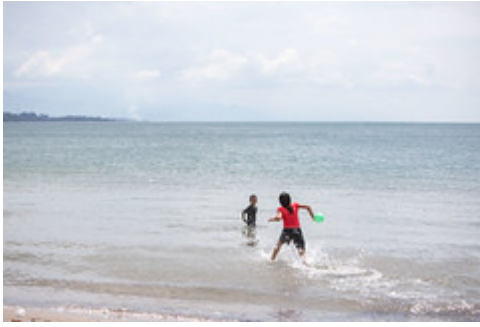
MINISTRO VISITA IZABAL-7 uploaded on 20 Aug 2021