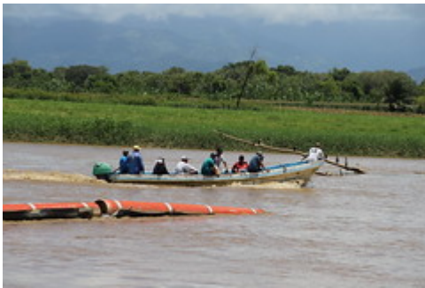
Motagua 2 by Ministerio de Ambiente y Recursos Naturales uploaded on 20 Aug 2021